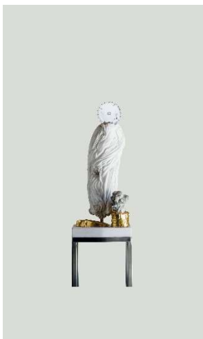
Pepo Pichler, MADONNA (PAYPAL), 2017, plastic, steel, concrete and goldleaf, 217 x 37,5 x 32 cm, Foto: f. Neumüller