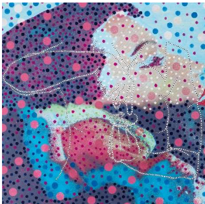
Pepo Pichler, ALL AROUND (series: RECORD COVERS), 2015, ink print and ink on canvas, 100 x 100 cm, Foto: F. Neumüller