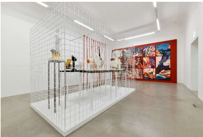
Ausstellungsansicht Pepo Pichler. a glimpse , Museum Moderner Kunst Kärnten, 2021