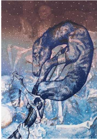
Pepo Pichler, o. T. (series: THRUST INTO THE WORLD), 2020, ink print and ink on canvas, 200 x 140 cm