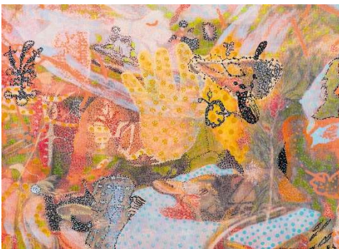
Pepo Pichler, DANDALA –THE HAND (series: VODOU STILLIF ES), 2006–14, ink print, ink and egg tempera on canvas, 55 x 75 cm, Foto: F. Neumüller