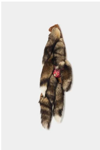
Pepo Pichler, URBAN FO XINA (series: FETISH), 2015, plastic and fox tails, 105 x 36 x 15 cm, Foto: F. Neumüller