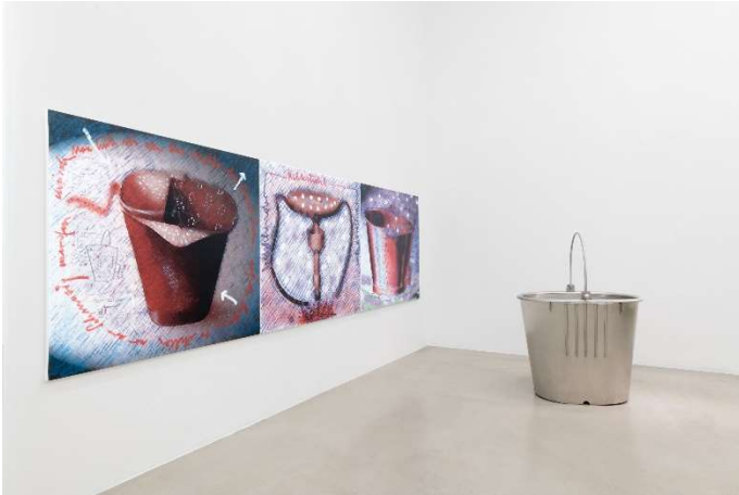
Ausstellungsansicht Pepo Pichler. a glimpse , Museum Moderner Kunst Kärnten, 2021