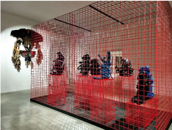
Ausstellungsansicht Pepo Pichler. a glimpse , Museum Moderner Kunst Kärnten, 2021