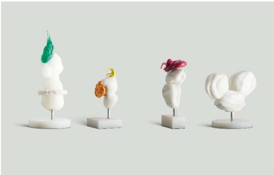
Pepo Pichler, HERMAPHRODITE (MONDELEZ), 2018, plastic, steel and host, 73 x 31 x 31 cm